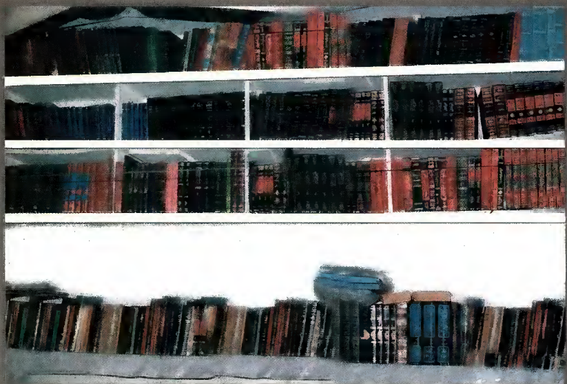
حضرت قاری صاحبؒ کی لائبریری میں سچی ہوئی کتب کا ایک خوبصورت منظر