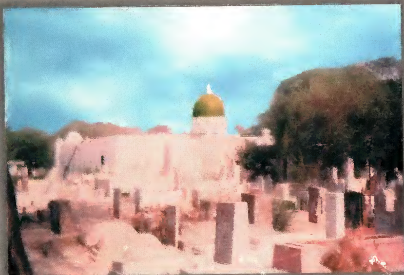
حضرت طاہر بندگی رحمہ اللہ کے مزار مبارک کا احاطہ