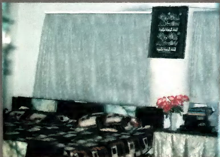
حضرت قاری صاحبؒ کے رہائشی کمرہ کا ایک منظر